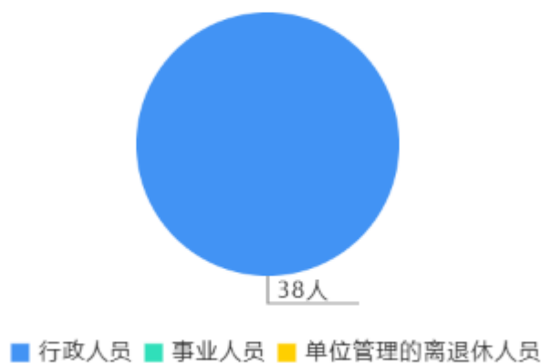
人员情况构成饼图

截止上年底，本单位人员编制30人，其中行政编制30人，事业编制0人；实有人员38人，其中行政38人，事业00人。单位管理的离退休人员0人。